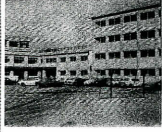
完成された新校舎

「越谷南立の新しい顔」を完成させた本校が、3月10日(火曜日)に新校舎の落成式を行いました。落成式には、約1,000名が参加し、新校舎の完成を祝いました。